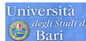
Facoltà di Agraria